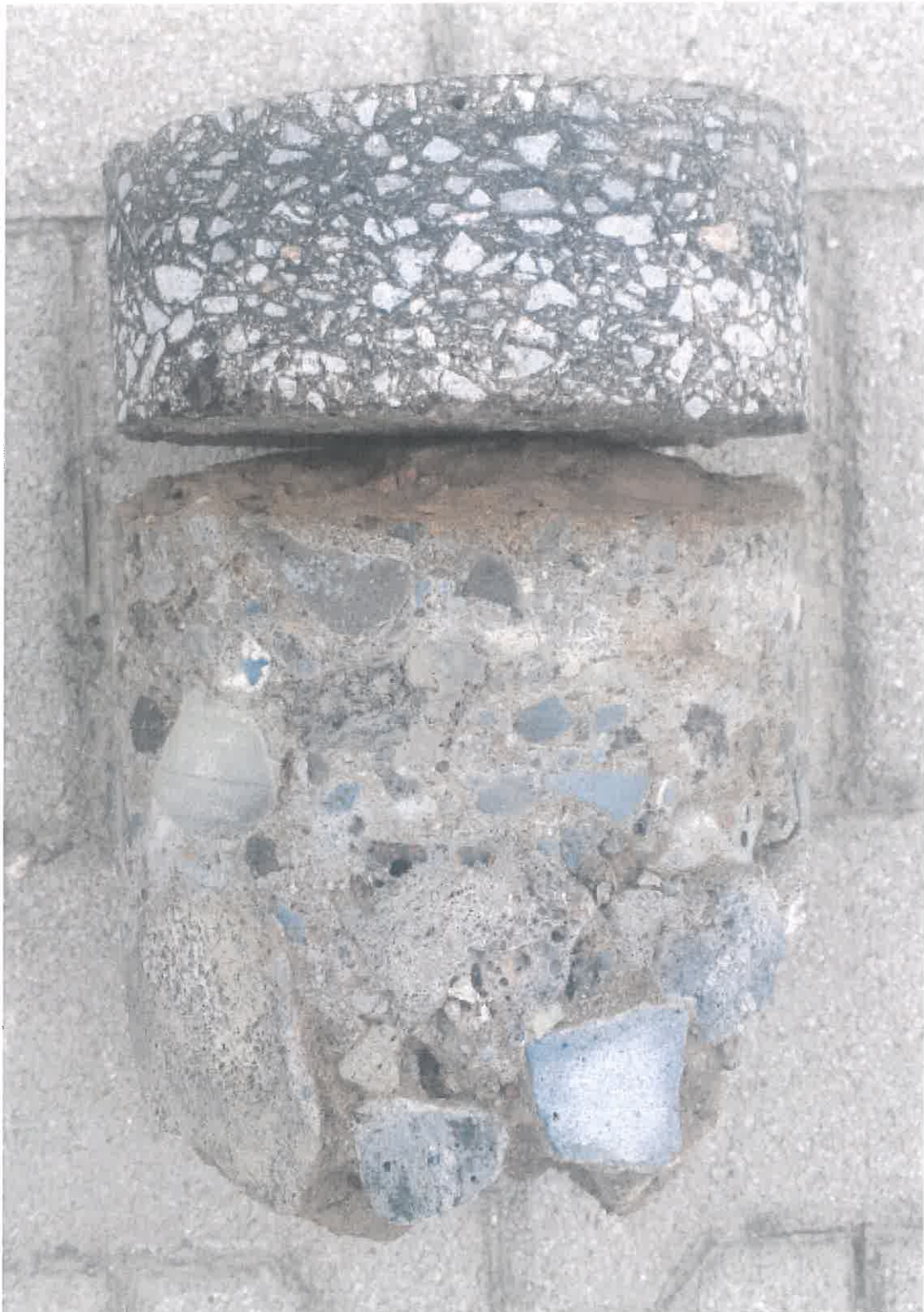
4. kép: Fúrt minta Nyíregyháza, Templom utca 0+950 km. sz. bal oldal tengelytől 2,6 m-re