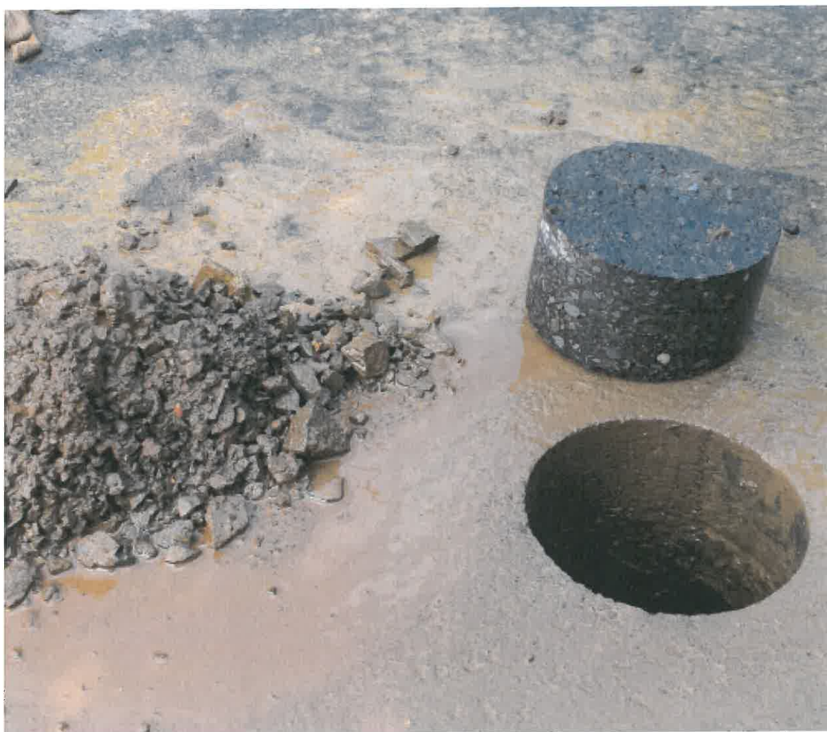
1. kép: Fúrást követően Nyíregyháza, Templom utca 0+475 km. sz. jobb oldal tengelytől 2,5 m

Rétegfelépítés: 39 mm aszfaltbeton kopóréteg (11 mm szemnagyság) 50 mm aszfaltbeton (8-11 mm szemnagyság) kb. 220 - 225 mm zúzottkő alapréteg Tükörszint (homok talaj)