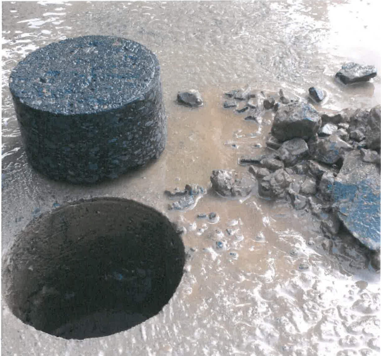
5. kép: Fúrást követően Nyíregyháza, Templom utca 1+150 km. sz. jobb oldal sávközép

Rétegfelépítés: 34 mm aszfaltbeton kopóréteg (11 mm szem nagyság) 54 mm aszfaltbeton (11 mm szem nagyság) kb. 100-105 mm zúzottkő alapréteg Tükörszint (homok talaj)